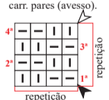
Diagrama 3 - Barra 2/2

OBS.: carr. ímpares (dir.), carr. pares (avesso).