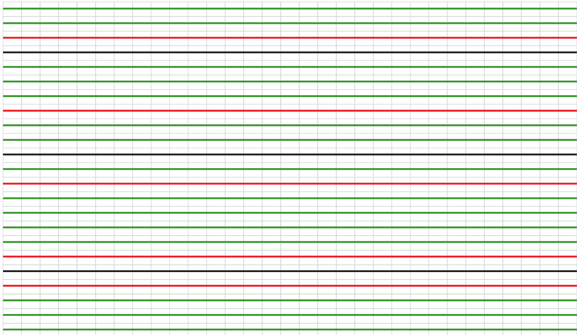
Gráfico Esquema de Montagem do Bordado

Inicie com 45 correntinhas + 5 correntinhas para virar o trabalho