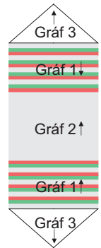
Esquema de Montagem