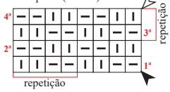
Diagrama 2 - Ponto fantasia

OBS.: carr. ímpares (direito), carr. pares (avesso).