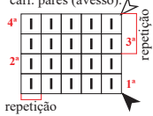
Diagrama 2 - Ponto meia

OBS.: carr. ímpares (direito), carr. pares (avesso).